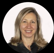
Precandidata a presidenta Myriam Bregman Diputada nacional por CABA (Partido de los Trabajadores Socialistas)

El Frente de Izquierda de los Trabajadores (FIT) está integrado por el Partido de los Trabajadores Socialistas (PTS), la Izquierda Socialista (IS), el Partido Obrero (PO) y el Movimiento Socialista de los Trabajadores (MST). Este Frente presenta dos fórmulas de pre candidatos a presidente: