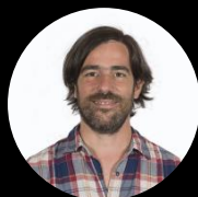
Precandidato a vice presidente Nicolás del Caño Diputado nacional por PBA (Partido de los Trabajadores Socialistas)