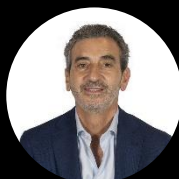
Precandidato a vice presidente Florencio Randazzo Diputado Nacional por PBA (Identidad Bonaerense)

El Frente de Izquierda de los Trabajadores (FIT) está integrado por el Partido de los Trabajadores Socialistas (PTS), la Izquierda Socialista (IS), el Partido Obrero (PO) y el Movimiento Socialista de los Trabajadores (MST). Este Frente presenta dos fórmulas de pre candidatos a presidente: