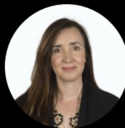
Precandidata a vice presidenta Victoria Villarruel Diputada nacional por CABA (Partido Libertario)

Los más recientes sondeos muestran que el espacio mantiene una fuerte intención de voto en el plano nacional y se consolida la idea de una elección de tercios.