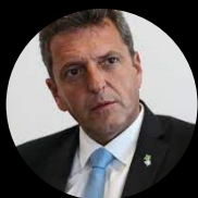
Precandidato a presidente Sergio Massa Ministro de Economía de la Nación (FR)