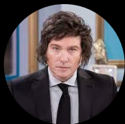
Precandidato a presidente Javier Milei Diputado nacional por CABA (Partido Libertario)