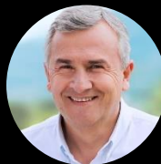
Precandidato a vice presidente Gerardo Morales Gobernador de Jujuy (UCR)