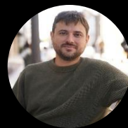
Precandidato a presidente Juan Grabois Referente del Movimiento de Trabajadores Excluidos (MTE) - Patria Grande