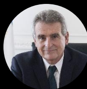
Precandidato a vice presidente Agustín Rossi Jefe de Gabinete de Ministros (PJ)