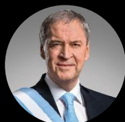
Precandidato a presidente Juan Schiaretti Gobernador de Córdoba (PJ)

Hacemos por Nuestro País es una coalición política creada para participar en las elecciones presidenciales de Argentina 2023, resultado de la unión entre el peronismo no kirchnerista , el Partido Socialista, el Partido Demócrata Cristiano, el Partido Autonomista y otras fuerzas provinciales.