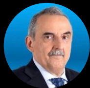
Pre candidato a presidente Guillermo Moreno Ex Secretario de Comercio Interior (Principios y Valores)

Principios y Valores es un partido peronista con tendencia justicialista creada en 2020 por múltiples ex funcionarios de Cristina Kirchner.