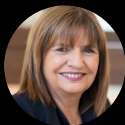
Precandidato a presidente Patricia Bullrich Ex presidenta del PRO y ex Ministra de Seguridad de la Nación