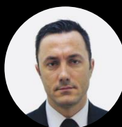
Precandidato a vice presidente Luis Petri Ex diputado nacional por Mendoza (UCR)

El primer desafío electoral de Juntos por el Cambio es ser la única coalición que cuenta con una interna competitiva . A ello se suma la dificultad de retener los votos del espacio para las elecciones generales , ya que en el caso de que triunfe Horacio Rodríguez Larreta, tendrá la compleja tarea de conquistar a los votantes de Bullrich para evitar que la opción sea Javier Milei.