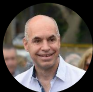
Precandidato a presidente Horacio Rodríguez Larreta Jefe de Gobierno CABA (PRO)